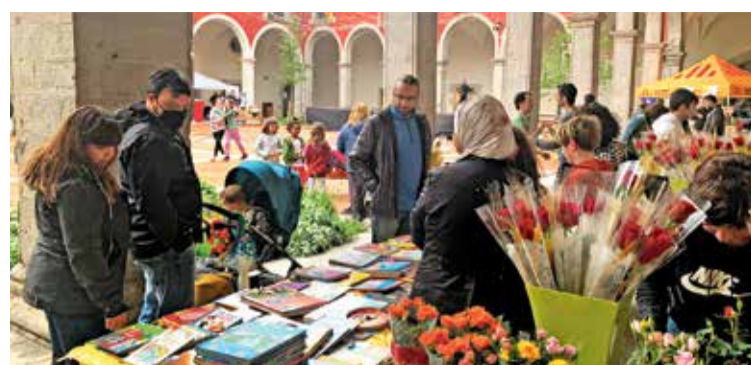
La celebració de l'any passat

A la programació hi destaca el concert del grup Northern Cellos, divendres 21 d'abril, a les deu de la nit, a la Sala Municipal